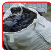
Films dans big bag