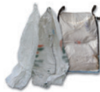
Big bags de produits fertilisants, semences et plants