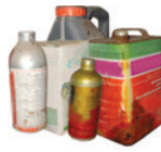
PPNU (Produits Phytopharmaceutiques Non Utilisables)