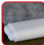
Voile non tissé, dont le P17