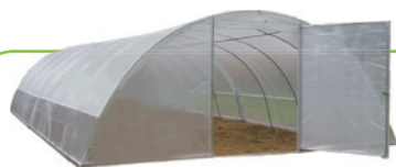
Couvertures de serres

Attention : ne pas mélanger les différentes classes de films entre elles !