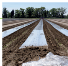
Films de paillage clair