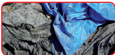
Films mélangés, en vrac