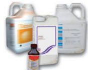
Bidons en plastique de produits phytopharmaceutiques et oligo-éléments