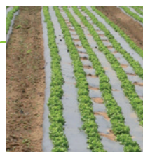
Films de paillage couleur