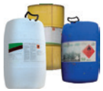
Fûts de produits phytopharmaceutiques et oligo-éléments