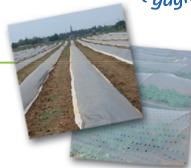
Films de solarisation, petits tunnels