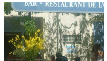
Bar Restaurant l'Ormeau Cabrières d'Aigues