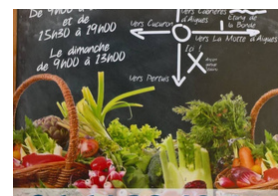
Panier Luberon Sannes