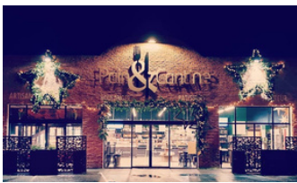
Pain & Cantine - Pertuis

Merci à l'ensemble des personnes qui ont participé à l'organisation de la fête votive de Cabrières d'Aigues, tout particulièrement les entreprises sponsors ci-dessous.