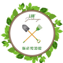
LUB'paysage La Motte d'Aigues