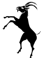
Équipe Municipale Cabrières d'Aigues